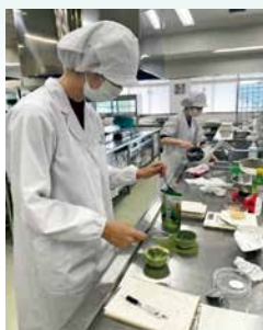
学生さんによる試作商品製造

今後も、安古市町商工会は、地域の魅力を発信する商品開発などを継続し、さらなる地域活性化を目指していきます。