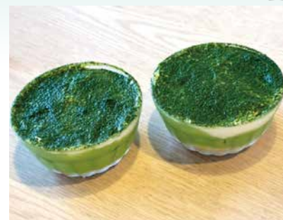
試作品 (The Farm)