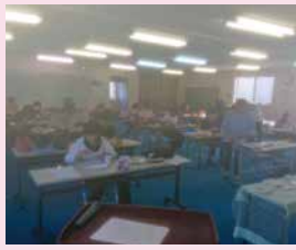
ポーセラーツの制作

10月12日に「ポーセラーツ制作教室」を開催しました。転写紙を使って絵付けをしたオリジナルペンダントや陶器を作りました。