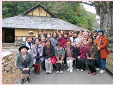
日帰りレクリエーション【菅谷たたら山内】にて

10月12日に「ポーセラーツ制作教室」を開催しました。転写紙を使って絵付けをしたオリジナルペンダントや陶器を作りました。