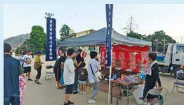
「安北小学校夏祭り」多くの皆様楽しんで頂きました!

8月3日(土)の安北小学校夏祭り、10月19日(土)の田中山神社のお祭りに安古市町商工会青年部が出店致しました。